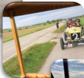
Sammeln und eine gute Fahrt