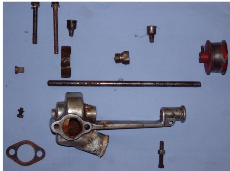
Hier sind alle Teile der Wasserpumpe nach Zerlegung zu sehen. Was fehlt ist die Graphitdichtung.

Der Ausbau der Pumpe ist sehr simpel. Wasser am Ventil des Kühlers ablassen und alle Anschlüsse die zur Pumpe führen lösen. Die Pumpe abschrauben und zerlegen.